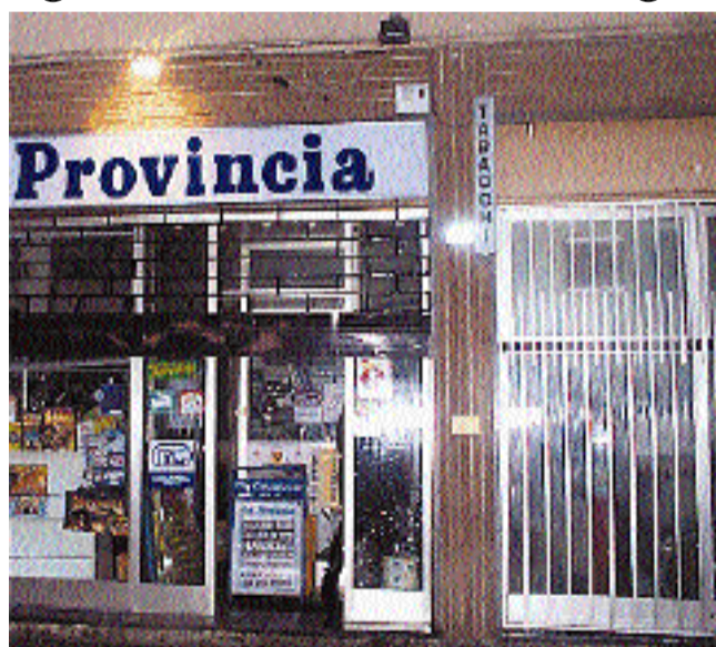
La rivendita di Novedrate dove è stato rapinato l'edicolante con la moglie

NOVEDRATE L'edicolante di Novedrate è stato aggredito e rapinato ieri sera da due malviventi che gli hanno puntato contro le pistole. Poco prima delle 20, il proprietario dell'edicola - tabacchi di piazza Umberto I, chiuso il negozio, si è avviato con la moglie verso la sua auto ed è qui che è stato raggiunto da due uomini, con il volto travisato, armati di pistola che gli hanno intimato di dare tutti i soldi, ma l'edicolante non ne aveva e allora i due hanno preso la borsetta della moglie, con circa 200 euro, e sono fuggiti su una Fiat Uno.