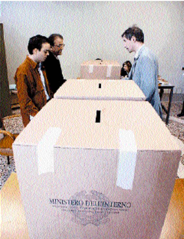
Ieri pomeriggio si sono insediati i seggi elettorali: si vota oggi e domani