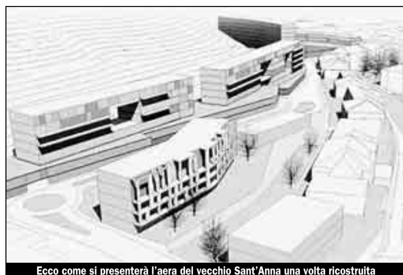
Ecco come si presenterà l'aera del vecchio Sant'Anna una volta ricostruita