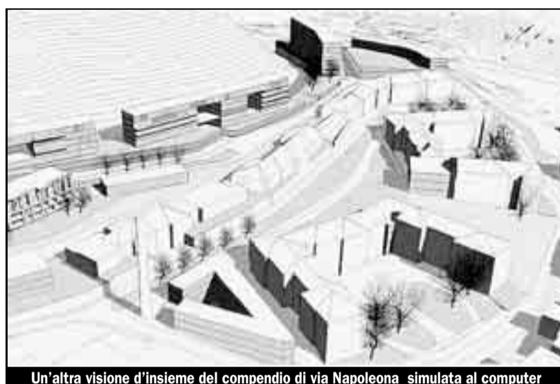
Un'altra visione d'insieme del compendio di via Napoleona simulata al computer