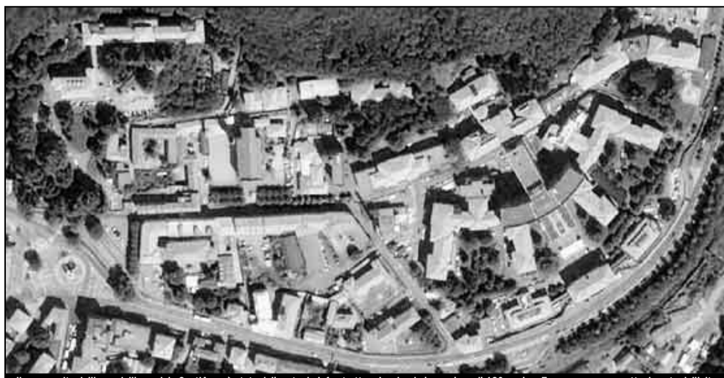
Il nuovo volto dell'area dell'ospedale Sant'Anna è stato delineato da Infrastrutture Lombarde in un piano di 130 pagine. Ecco come appare attualmente dall'alto

Confermata la divisione: 60% residenze, 40% servizi (scuole e case di riposo) Saranno edificati 153mila metri cubi al posto dei 147mila del monoblocco